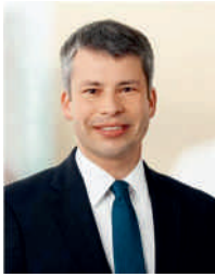
Steffen Bilger MdB Parlamentarischen Staatssekretär Bundesministerium für Verkehr und digitale Infrastruktur